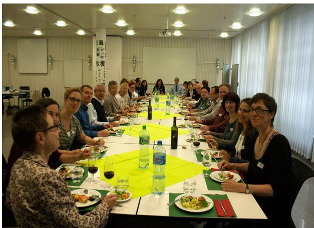
Les participant-e-s au lancement de la phase III partagent le repas

Le 24 mai 2016, 28 personnes ont pris part au lancement de la phase III (2016 – 2020) du programme Periurban à Berne. La rencontre a bénéficié à l'échange mutuel d'informations et d'expériences.