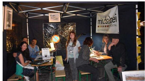
Nuit de la culture à Laufenburg, nous étions de la partie !

A partir d'octobre 2016, « mit.dabei-Fricktal » soutiendra la table ronde sur l'intégration à Rheinfelden. Nous en reprendrons la direction dans le but de renforcer cet espace de participation. Notre objectif est de fournir aux acteurs de la table ronde des informations et de nouveaux instruments, pour ainsi renforcer la participation dans la durée.